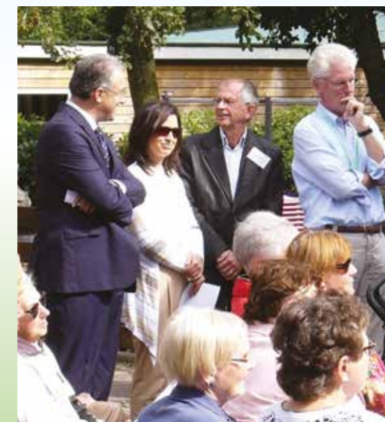
Burchemeester Aboutaleb op bezoek bij een concert

De Werkgroep Ommoordse Veld Open & Groen zet zich in voor het behoud van dit cultuurhistorisch waardevolle stukje veenweidelandschap. Wij organiseren diverse activiteiten om bezoekers de mooie omgeving te laten ervaren. Zo ook al 10 jaar lang de zondagmiddagconcerten op De Blijde Wei. Veel bewoners geven aan de concerten erg te waarderen. Het geeft kleur aan de zondagmiddag en je ontmoet er buurtbewoners in een ongedwongen sfeer. In normale tijden kun je komen en gaan wanneer je wilt en zelf een plekje in de zon of de schaduw zoeken. Dat is de afgelopen twee seizoenen door covid-19 anders geweest. Vooral in 2021 waren er veel beperkingen: maximaal 100 bezoekers, vooraf aanmelden, 1,5 m afstand, stoelen laten staan, alles met hekken afsluiten, EHBO